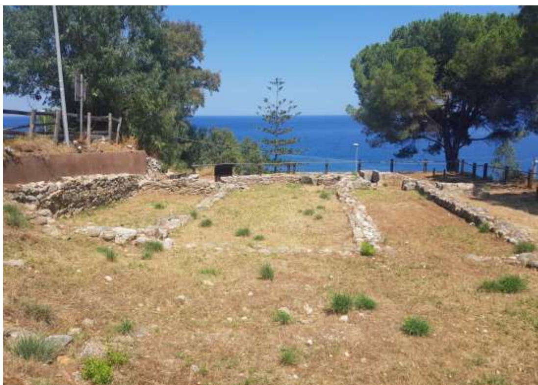
Chiesa di San Martino del Monastero vivariense