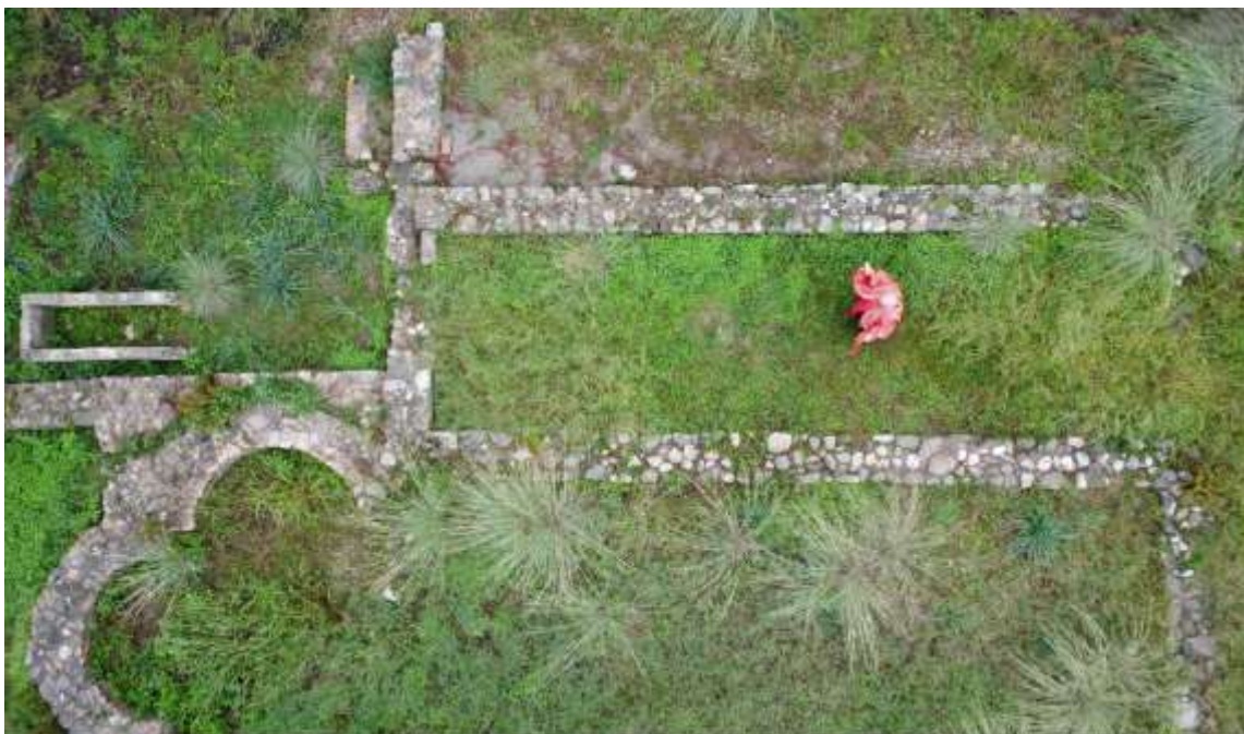
Chiesa di San Martino - ripresa da drone di living history con Cassiodoro