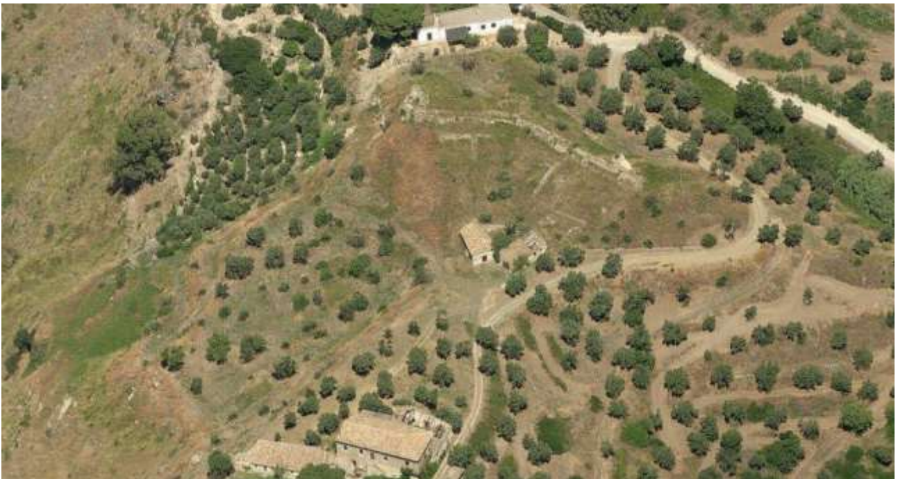
Castrum fortificato di Santa Maria del Mare