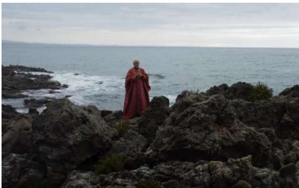
Link Video Senatore Aurelio Magno Cassiodoro