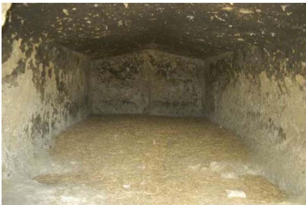
Rossano, grotte eremitiche di c. da Calamo