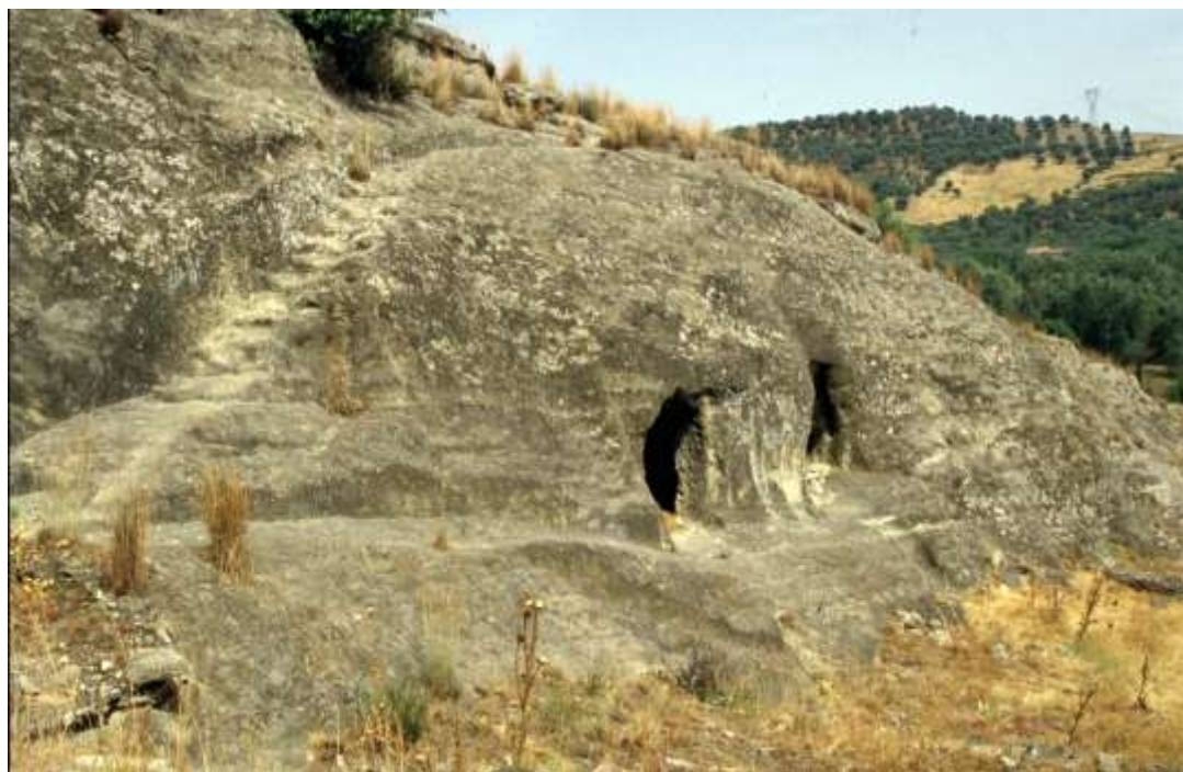
Rossano, grotte eremitiche di c.da Calamo

Partendo da Sud, la grotta più interessante è la terza, ricca di più ambienti, nicchie, archi e pilastri che la rendono affascinante anche riflettendo sulle persone che nei secoli se ne sono serviti e sulle tante possibili risposte relative all'utilizzo che la stessa era destinata a garantire loro. La grotta è provvista di un unico ingresso posto allo stesso livello del sentiero di accesso. Vicino all'entrata è presente un'altra apertura, a mo' di finestra, ricavata su una parete dove è realizzato un grande arco cieco. Entrando, subito a destra, si trova uno scavo di forma rettangolare, forse non completato, dopo il quale c'è un'apertura che consente di entrare in una piccola cella quadrangolare.