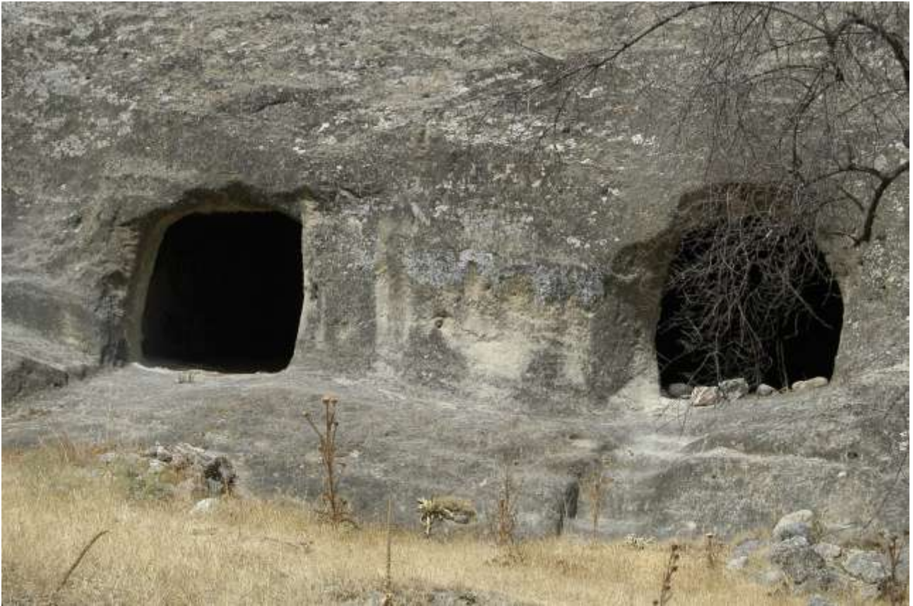
Rossano, grotte eremitiche di c.da Calamo